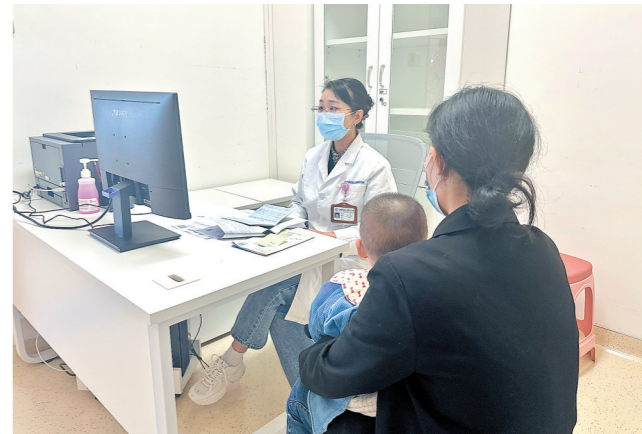
医生正在为患儿看诊

由于通常接种流感疫苗2到4周后会产生具有保护水平的抗体,抗体在6个月内能维持在保护基线水平,再加上历年监测表明,广东流感在冬春季和夏季活动水平高,因此胡丹丹建议市民在11月至12月接种流感疫苗,不仅可以避免感染第一波冬季流感,对于预防夏季流感小高峰也有保护作用。