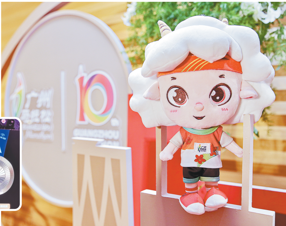
广马吉祥物形象

记者还了解到,组委会对选手的服务持续升级。比赛当天,除了饮水饮料站之外,还将设置7个食品补给站,为选手提供充足的能量胶、香蕉及广式糕点等补给,助力选手顺利完赛。