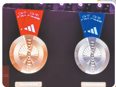
马拉松、半程马拉松完赛奖牌

今年组委会在赛事服务等方面做出优化,广马将首次运用“人脸识别”系统,分别在赛前领物、比赛日选手检录入场及完赛