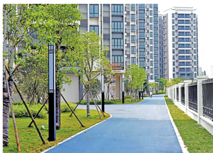
安置房实景图

平西安置区以“非凡两公里,乐享生活环”为设计理念,充分尊重村民意愿,原址保护树塘传统民居及风水塘。同时,思明西校和笃庆庄传统民居也被实施原址保护,拟分别活化利用为教学用房与文化街区、社区活动中心,传承教育文化功能,为城镇化发展留住故土乡愁。安置区配套健全的教育设施,从幼儿园到高中一应俱全,尤其是引进了广州市第六中学,计划于2024年建成使用,实现重点学校