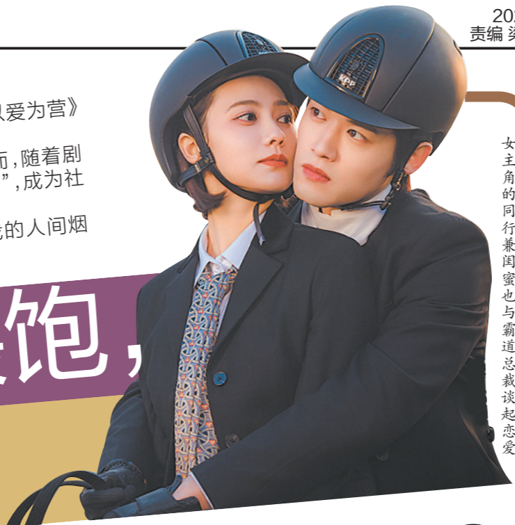
女主角的同行闺蜜也霸道总裁谈起恋爱