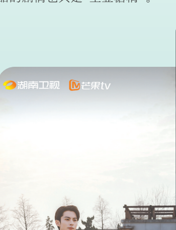
带着“报复前男友”的动机接近男主