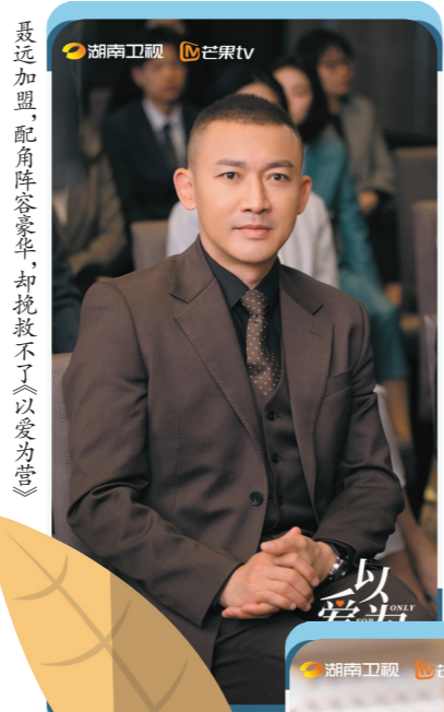
最近加盟，配角阵容豪华，却挽救不了《以爱为营》

11月20日，人民文娱发表了《<以爱为营>为何惹恼新闻人？》的评论文章，认为“这种情节既不能凸显主角的个人魅力，也无法让观众感到共情，更不具备职场戏份该有的专业性和励志感”。该文进而指出：“近年来，一些影视剧的职场描写总被观众诟病脱离实际，更有不少网友指出‘又是一个没上过班的编剧’，其本质原因仍是创作者对行业、对现实、对生活的观察不够、研究不够。为了某种甜，硬写某种苦，到最后都是套路。只为剧情铺路，不认真撰写生活和现实，不仅损害作品本身质量，也是对相关行业与广大观众的不尊重。文艺创作遵循来源于生活而高于生活的规律，如果脱离生活、脱离实际，再甜的剧情也只是‘工业糖精’。”