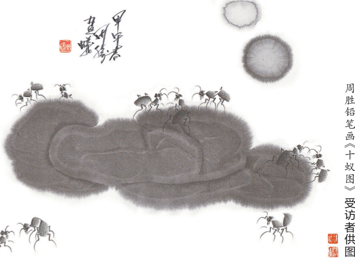
周胜铅笔画《十蚊图》