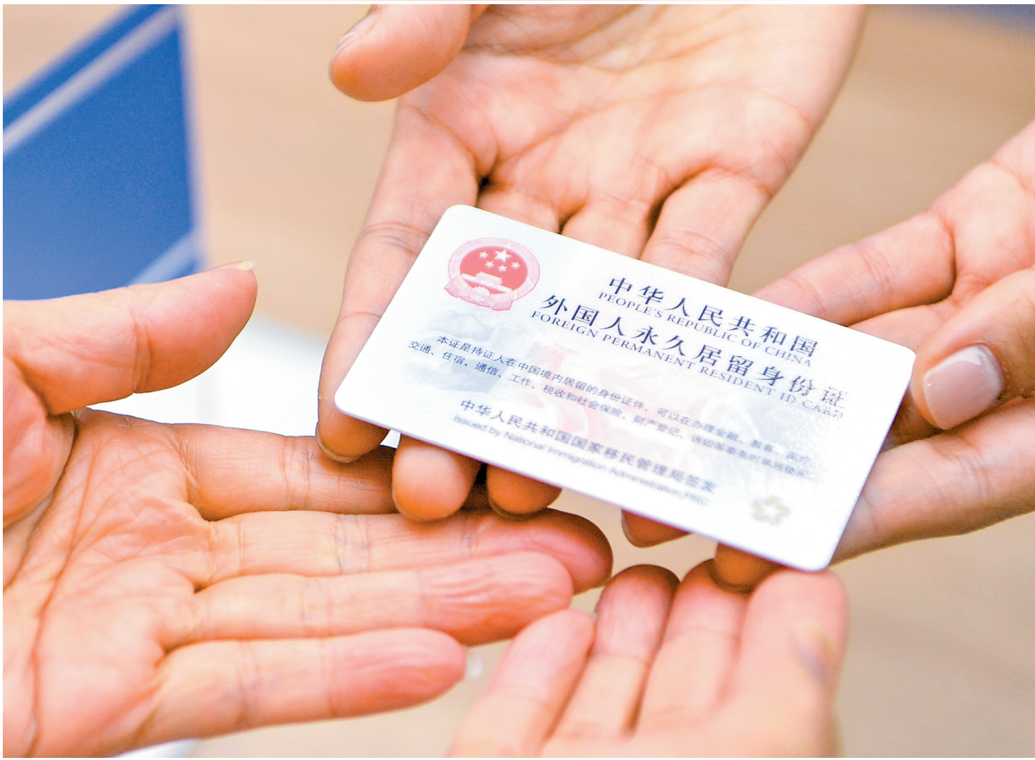
这是12月1日在天津市公安局出入境管理局拍摄的一张新版中华人民共和国外国人永久居留身份证