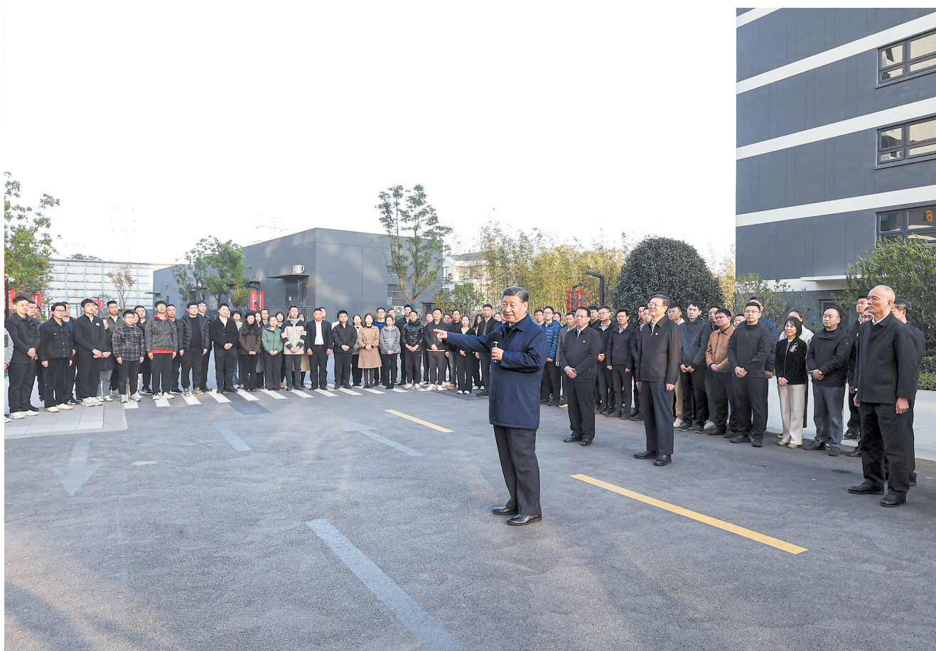
11月29日下午，习近平在上海市闵行区新时代城市建设者管理者之家，同社区居民亲切交流

新华社电 中共中央总书记、国家主席、中央军委主席习近平近日在上海考察时强调，上海要完整、准确、全面贯彻新发展理念，围绕推动高质量发展、构建新发展格局，聚焦建设国际经济中心、金融中心、贸易中心、航运中心、科技创新中心的重要使命，以科技创新为引领，以改革开放为动力，以国家重大战略为牵引，以城市治理现代化为保障，勇于开拓、积极作为，加快建成具有世界影响力的社会主义现代化国际大都市。在推进中国式现代化中充分发挥龙头带动和示范引领作用。