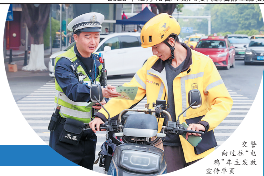
交警向过往“电鸡”车主发放宣传单页

行。”数名交警和交通志愿者对过往“电鸡”进行劝导，向车主发放宣传单页，引导其按规出行。 记者在劝导岗附近看到，一位外卖小哥无法骑“电鸡”行驶进东风东路，于是提着餐品快步往东风东路走去。同时，也存在“拦不住”的情况，少数“电鸡”车主车速飞快，不顾劝导，强行冲进了限行路段。 中午12:00左右，记者又来到了黄埔大道西（石牌东路以西）走访。在此处，记者听到喇叭中循环播放着“骑电动自行车可以绕行金穗路”的通行指引。在早前的走访中，记者观察到，该路段非机动车与机动车混行的现象非常严重，而在限行新规实施首日，记者看到，该路段“电鸡”车流量仍然很大，数名交警在此引导过往“电鸡”绕行或推行，但在交警看不到的限行路段上，仍有部分“电鸡”车主骑行，甚至逆行。