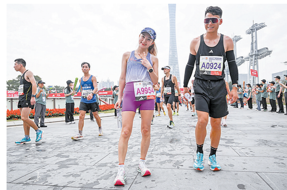
跑者轻松合影,参赛体验上佳

世界田联金牌计划于2008年设立,是一套针对路跑赛事的分级管理体系,早期只包括金标和银标两个大类,我国的北京马拉松和厦门马拉松是首批金标赛事之一。2018年全球共有40个国家的114项赛事入选金牌赛事,其中就包括广马在这一年被评为金牌赛事。 自2019年起,世界田联推出白金标赛事等级,目前中国的上海马拉松和厦门马拉松为白金标赛事。根据世界田联最新数据,2023年全球共有257场银牌赛事(15个白金标、39个金标、72个精英标、131个银牌赛事),中国共有68场路跑赛事获评银牌,数量上居于全球首位。 世界田联金牌计划实际上是一个针对全球少数精英运动员的办赛服务标准,这意味着申请银牌赛事需要花费高昂的费用,以资助极少数的国际精英运动员。 据崔璐介绍,今年11月29日,世界田联对2024年银牌路跑赛事的申请标准进行了更新,主要对金牌赛事与白金标赛事的申请要求、最低奖金设置、银牌赛事认证费用等方面作出细化。 根据世界田联发布的2024白金标赛事条件,要想从金标“上标”至白金标,必须同时满足三个条件:2023年获得金牌;2023年“参与分”达到或超过100分(至少每个性别有3名白金标等级运动员+至少每个性别有4名