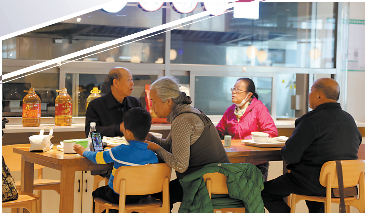
长者饭堂一定程度上满足了老年人的社交需求