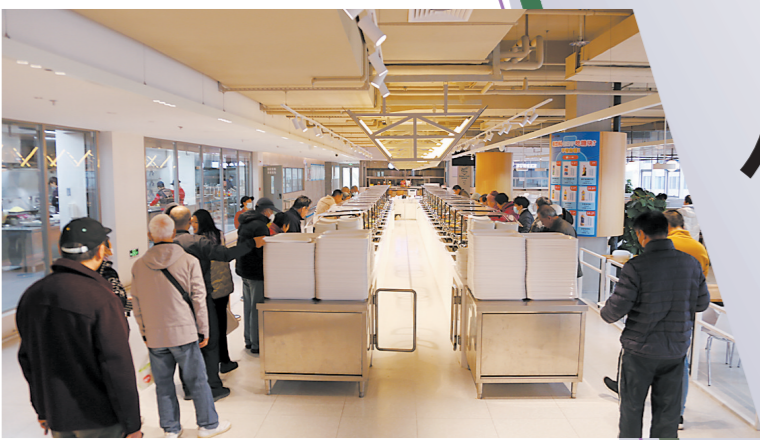
老年人在长者饭堂排队选餐

“老人满意不满意是检验‘长者饭堂’提质增效工作的唯一标准。”高宏伟说，“我们坚持‘公益化+市场化’可持续发展路径，以‘长者饭堂’提质增效示范点建设为契机，持续优化‘长者饭堂’运营，不断挖掘新的示范应用场景，成熟一批推出一批，以实际行动将民生工作落实落细落具体，推动民政领域主题教育走深走实、见行见效。”