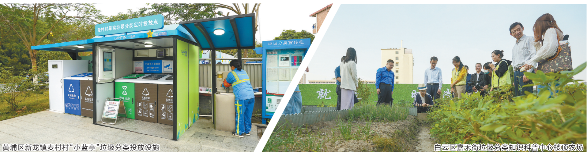
黄浦区新龙镇麦村村“小蓝亭”垃圾分类投放设施

餐厅依托珠海优特智能科技有限公司研发的智能烹饪设备，打造全电智慧厨房。比起以往长者饭堂配餐菜式固定单一，优特社区餐厅不仅可以自选菜式，还能称重计费，丰俭由人。