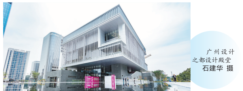
广州设计之都设计殿堂

开幕式上，广州市白云区人民政府与世界绿色设计组织(WGDO)、工业和信息化部国际经济合作中心分别签订《共同促进粤港澳大湾区可持续发展战略合作协议》《共同促进粤