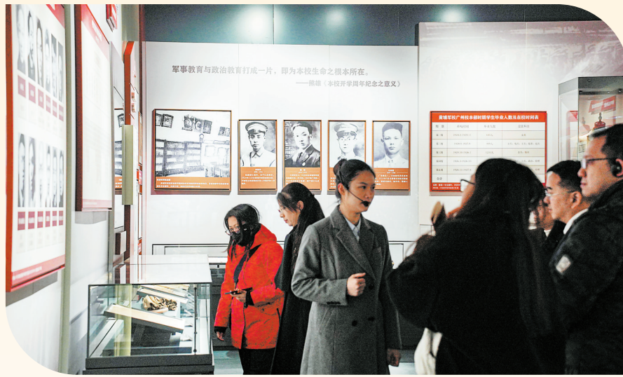
观众通过该展学习广州红色历史

历经两年策划实施的“红色广州 英雄城市——广州革命历史陈列”，于12月22日正式向公众开放。该展由广东革命历史博物馆策划，设在广州近代史博物馆(广东咨议局旧址)，展出实物展品581件、历史照片235张、艺术场景17处、多媒体展项16个，让观众通过该展读懂广州百年革命历史。