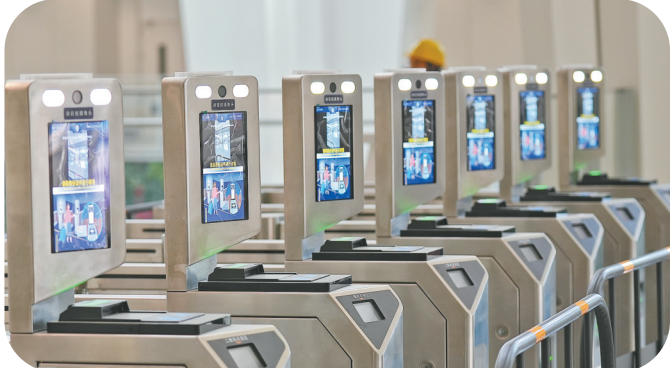
广州白云站一设施已准备就绪