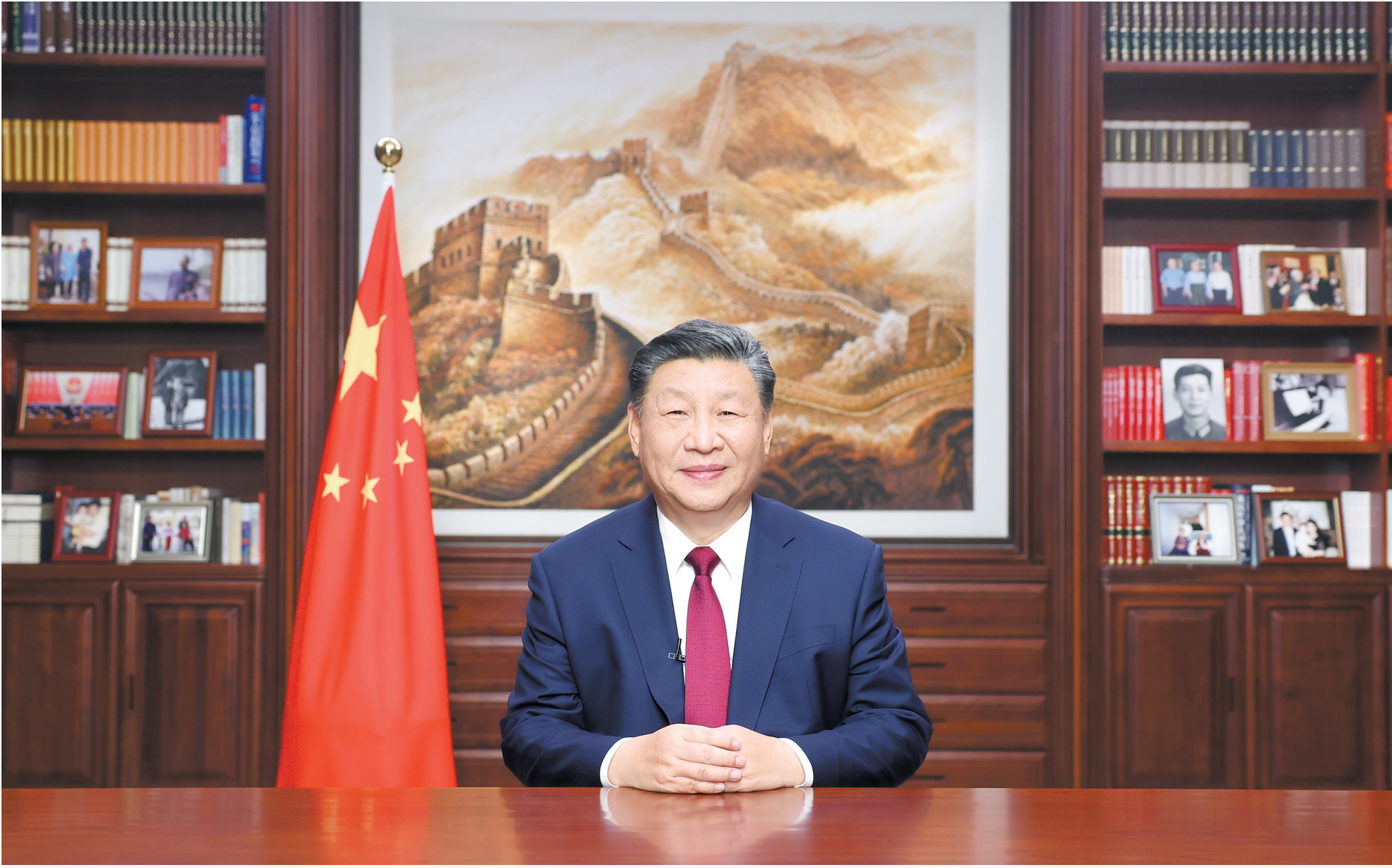
新年前夕，国家主席习近平通过中央广播电视总台和互联网，发表二〇二四年新年贺词

新华社北京12月31日电 新年前夕，国家主席习近平通过中央广播电视总台和互联网，发表了二〇二四年新年贺词。全文如下：