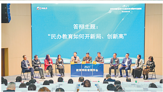
2023年 教育领航者 同学会现场