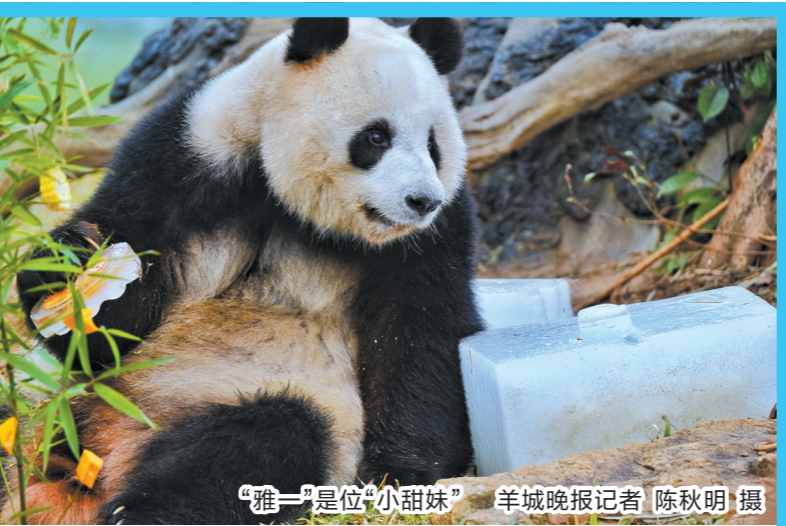
“雅一”是位“小甜妹”

羊城晚报讯 记者马思泳报道：广州市林业和园林局近日在官网发布《广州动物园系列项目建设策划方案(征求意见稿)》(以下简称《征求意见稿》)的公示。