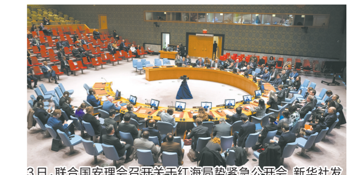
3日，联合国安理会召开关于红海局势紧急公开会

新华社电 伊朗东南部历史名城克尔曼市3日发生两起爆炸事件，造成近百人死亡、逾200人受伤。