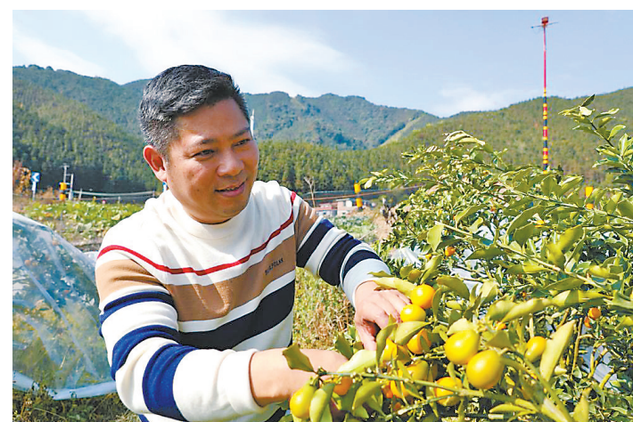
脆蜜金桔迎来丰收

下一步，丰茂农场计划扩大种植规模，形成脆蜜金桔产业带，提升种植技术，打造更优质精品水果产业，使脆蜜金桔精品水果产业真正成为“幸福果”“致富果”，助力连山乡村振兴。