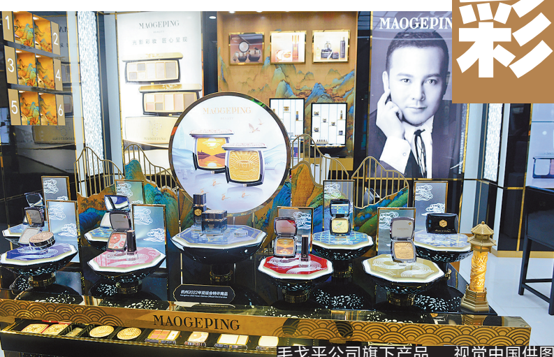
毛戈平公司旗下产品

公开资料显示，毛戈平公司2000年7月28日在杭州成立。公司法定代表人毛戈平以“刘晓庆御用化妆师”出名，并先后为多部影视剧和舞台剧进行化妆造型设计，是中国化妆界的标志性人物。在行业积攒了足够的名气和声望后，毛戈平先后成立了毛戈平形象设计艺术学院，并推出国内首个以个人名字命名的高端彩妆品牌MAOGEPING。其旗下化妆品也因毛戈平“换头级”化妆术一度受到消费者追捧。