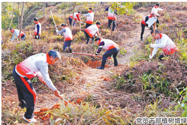
党员干部植树增绿

百镇攻坚行动围绕美丽圩镇建设工作重点，大力实施环境卫生整治、圩镇秩序管控、基础设施提标、服务功能提质、特色风貌提升、社会治理增效“六大行动”，对标对表推进圩镇人居环境品质提升。该行动通过深入开展圩镇人居环境品质提升，全面提升圩镇人居环境、基础设施水平，提升农村基本公共服务水平，打造“千干净净、整洁整齐、长长久久”的美丽圩镇。