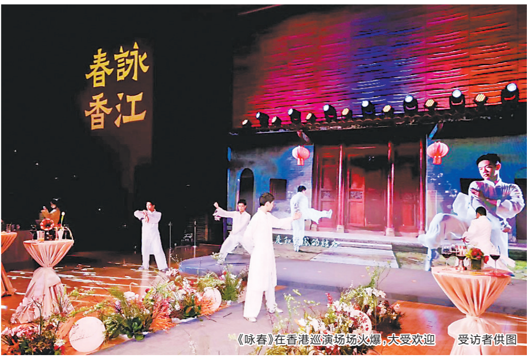
《咏春》在香港巡演场场火爆，大受欢迎

《咏春》将中华武术的速度力量与现代舞蹈的行云流水融为一体，既让观众看到传统武术“攻防技击”的气势，又展现了舞蹈艺术优雅舒展的肢体美感，给香港观众留下深刻印象，成为深圳勇于文化创新以及深港文化交流“双向奔赴”的成功范例。