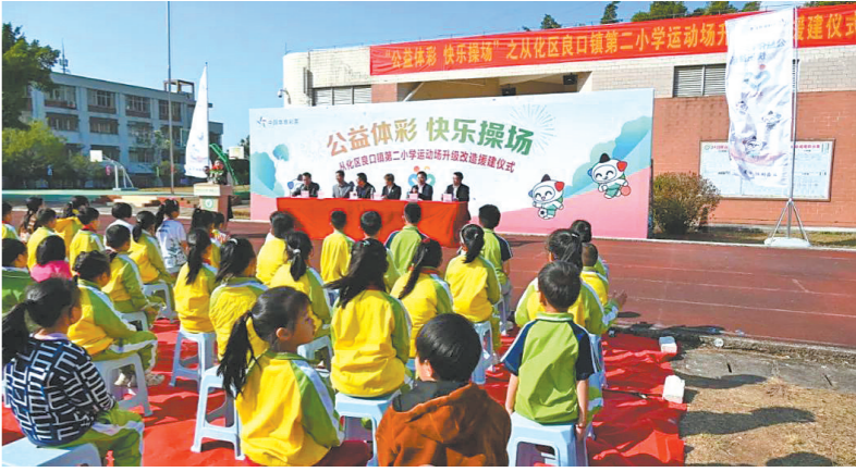
广州体彩向学校捐赠38万元

未来，“公益体彩 快乐操场”活动还将在广州继续开展下去，为有需要的学校和孩子们送去关心与支持，让更多的孩子在体育运动中享受到快乐，点燃孩子们心中的梦想之光。(胡彦 李琪)