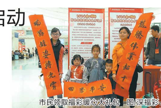
市民领取福彩暖心大礼包

为关爱来深建设者留守儿童，非深户来深建设者如有在户籍地参加义务教育的子女，在深圳福彩服务号成功报名“爱心福彩·资助来深建设者返乡”活动之后，可继续报名参与“爱心福彩资助来深建设者春节返乡-公益助学”项目。在成功得到返乡车票资助后，方有资格获得助学活动的资助。助学项目由深圳市广电公益基金会提供专项资金，预计资助100个家庭，每个家庭