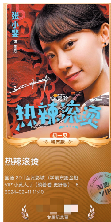
《热辣滚烫》淘票票电子纪念票