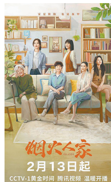
CCTV-1黄金时间 腾讯视频 温暖开播