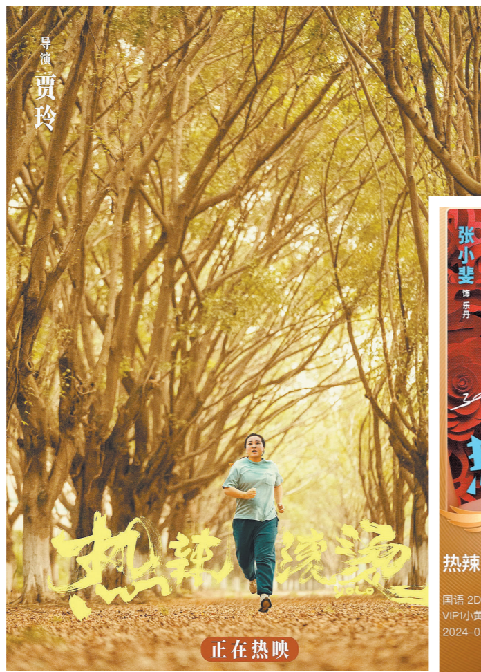
《热辣滚烫》四季版海报