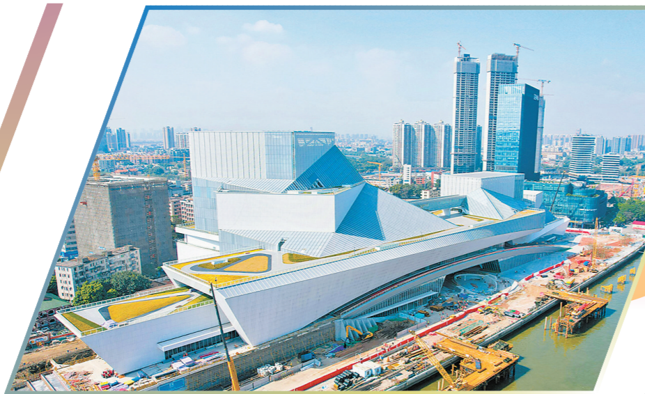
位于荔湾区白鹅潭的三馆合一项目