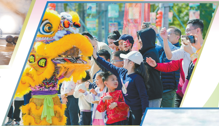
珠海横琴星乐度露营地小镇