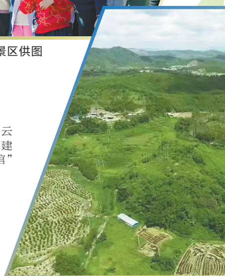
广东省英德岩山寨遗址地貌 (资料图片)