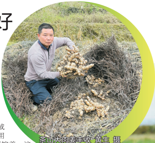
茶山大肉姜丰收

近年来,茶山镇有关部门致力做好“姜保姆”,通过引导网红带货、自媒体宣传等方式,让全国各地更多的消费者能了解到茶山大肉姜的好品质,购买到新鲜的大肉姜,促进群众增收致富。下一步,茶山镇将继续培育壮大大肉姜产业,让大肉姜种植呈现规模化、品牌化、效益化发展,促进群众增收致富,推动乡村振兴。