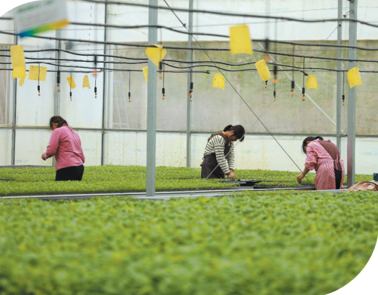
韶关市翁源县乡村振兴种苗繁育中心年产水稻秧苗6万亩,蔬菜5万亩