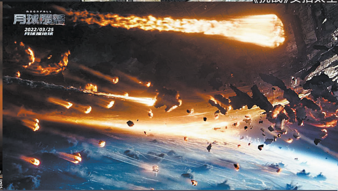
《月球陨落》展现了月球碎片砸向地球的画面