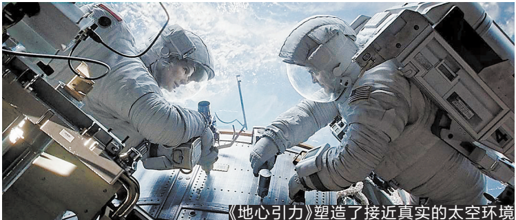
《地心引力》塑造了接近真实的太空环境

同样来自废弃卫星碎片的袭击，瑞安·斯通和麦特·科沃斯基失去控制，坠入无垠的宇宙深处…… 在距离地球600公里的高空，寒冷、黑暗、死寂。《地心引力》之所以是一部太空惊悚片，很大程度上正是因为它通过塑造接近真实的太空环境，唤起人类内