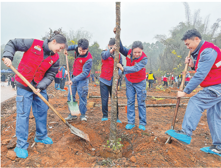
3月4日，南方电网广东佛山供电局青年志愿者们参加植树活动

电交易也在迅速发展。2021、2022、2023年绿电成交量分别为0.28亿、15.4亿、39.7亿千瓦时，预计2024年绿电成交量将超50亿千瓦时。自2021年6月首次启动绿电交易到2024年3月，广东绿电交易电量93亿千瓦时，相当于减少二氧化碳排放量逾729万吨，种植了1400万棵树木。