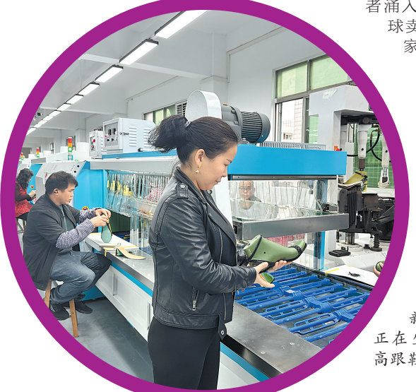
新厂房中正在生产外销高跟鞋产品

数据显示，广州自2016年设立跨境电商综试区以来，持续以改革创新思维推动多项全国首创举措引领行业发展。已累计参与制定国家、行业标准13项，出台便利化政策150项、促发展政策325项。在商务部2021年和2022年跨境电商电子商务综合试验区评估中，广州均位列全国第一档“成效明显”，多个第三方权威机构出具的跨境电商综试区评估报告均显示，广州位居全国跨境电商综试区第一梯队“引领发展”城市首位。广州已成为一座名副其实的“跨境电商之城”。