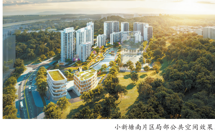
小新塘南片区局部公共空间效果图

小新塘南片区共设置公共服务设施9类47处。规划重点考虑学校、卫生医疗等民生设施的配置；结合绿地等公共空间和裙楼空间增加群众性体育运动场地、居民健身场所等的设置，配置文化站、文化室等艺术文化设施。面向居住社区的新建公共建筑面积占居住地块建筑面积的比例高达17.7%。 据介绍，规划以奥体北路作为小新塘南片区主要界面制高点，形成向周边逐步跌落的整体空间形态，勾画富有变化的城市天际线。同时打造共享开放的公共空间，山体公园、湖滨公园、街角公园等多尺度、多样化的公园，为市民提供高品质的休闲场所。 小新塘南片区以“两横两纵”路网结构接驳区域交通，可在10分钟内到达交通节点，快速实现南联金融城、西接五山高新区、北通智慧城、东达黄埔的区域交通联系。规划通过轨道引领和常规公交补充完善公共交通网络，新增公共汽（电）车站1处。同时关注“最后一公里”，结合轨道站点、路网、山水空间等打造通达连续的慢行网络。