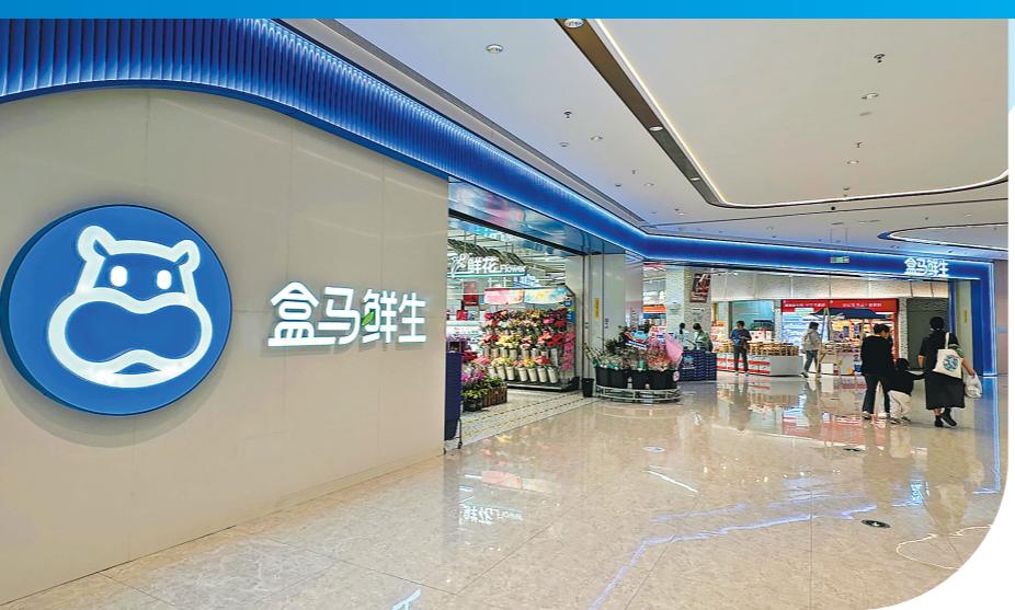
盒马鲜生广州黄埔大悦汇店

而3月初,盒马被传出在多个城市清货关门,对此,盒马发回回应表示,由于物业合同到期和个别商场不景气等原因,今年上半年全国范围内会关闭