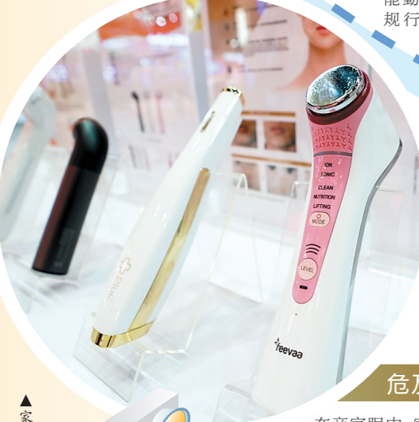
▲家用美容仪使用安全备受关注