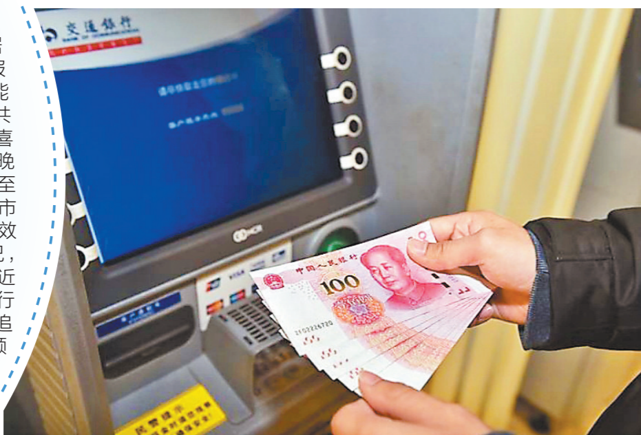
▲越来越多银行公开渠道透露“反向讨薪”情况

在银行上班一年能挣多少钱？答案是到手的薪酬有可能还要“还回去”。随着银行的绩效薪酬追索数据出现在不少银行年报中，到手的薪酬有可能被追索已成行业共识，“反向讨薪”再度“喜提”网络热搜。据羊城晚报记者不完全统计，截至3月31日，共10家上市银行在年报中公布绩效薪酬追索扣回相关情况，累计“反向讨薪”金额近亿元，其中招商银行2023年年报显示，其追索扣回绩效薪酬总金额4329万元，较2022年的5824万元有所下降。两年时间，招商银行累计追索回的绩效薪酬超一亿元。