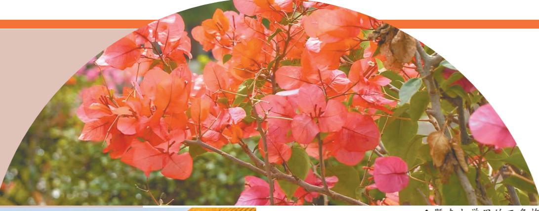
南方医科大学宫粉紫荆