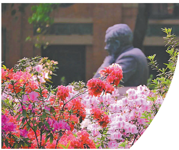
中山大学里的杜鹃林