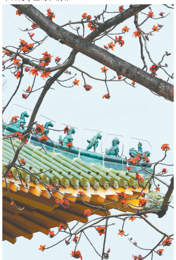
华南理工大学的木棉花