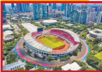
广州天河体育中心