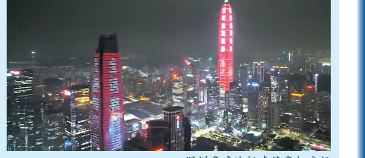
深圳多地标建筑亮灯庆祝十五运