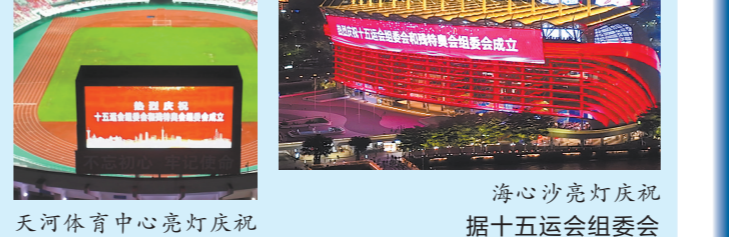
天河体育中心亮灯庆祝十五运