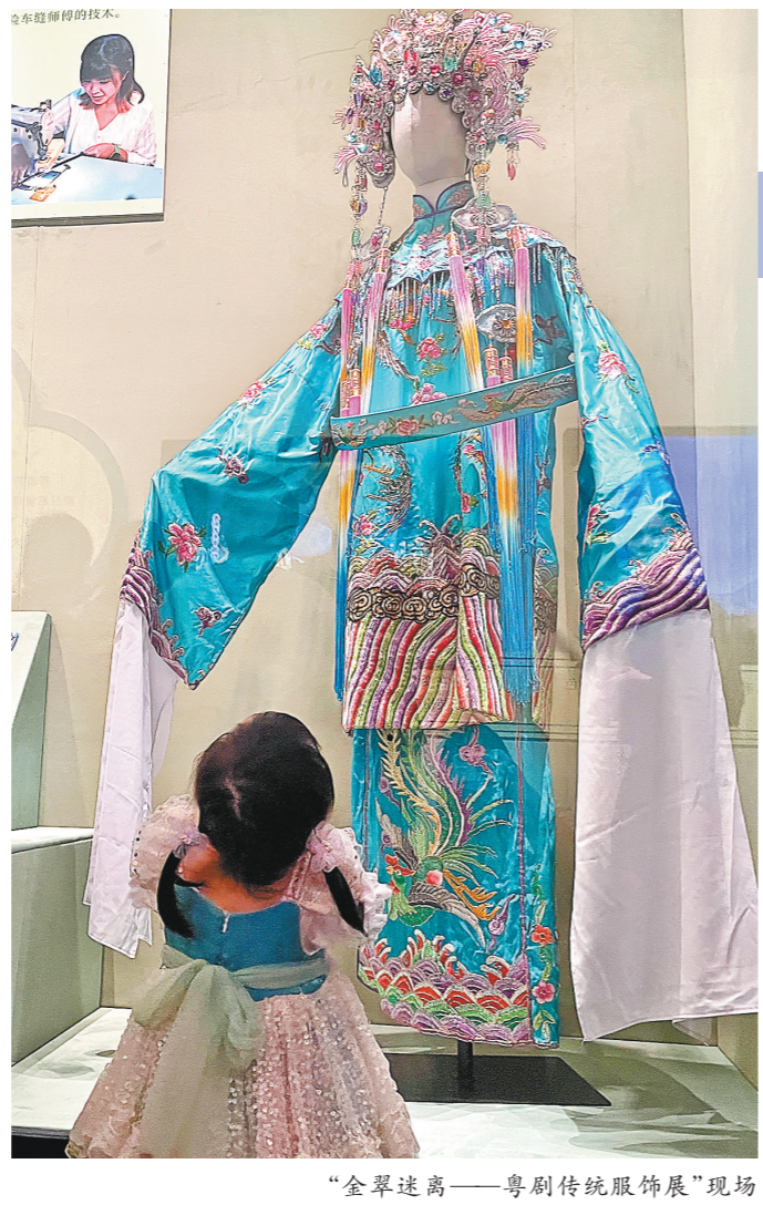
“金翠迷离——粤剧传统服饰展”现场

羊城晚报讯 记者黄婷、通讯员叶小亮报道:4月13日(周六),一列跨境电商中欧班列从广州国际港鸣笛起航,将在约17天后抵达波兰马拉舍维奇。本趟班列运载货物品类丰富,主要包括珠三角地区企业生产的小家电、服装箱包、日常用品和玩具等跨境电商货物,货重约672吨,货值为4120余万元。货物抵达波兰后将分拨发往德国、意大利、西班牙等多个欧洲国家。实际上,如今像这样远赴欧洲的跨境电商班列,每周六都会如期从广州国际港发车。记者从广东广物国际物流发展有限公司(以下简称“广物国际物流”)获悉,今年以来,该公司加大去欧洲跨境电商班列的运营力度,在广东省内率先实现周班开行,每周周六发车,切实解决企业在华南地区发运跨境电商货物班列班期不稳定、时效不稳定的痛点;货物就近在广州集结,减少跨境电商企业流通环节、成本,更好地服务有跨境电商发运需求的企业。接下来,广物国际物流将继续探索