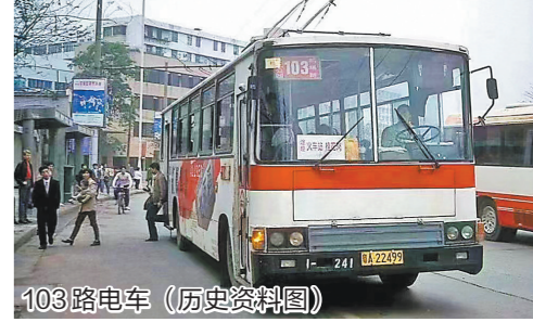
103路电车 (历史资料图)

羊城晚报讯 记者严艺文报道:4月12日,广州市交通运输局发布《关于调整公共汽车102、416、783、705、103、664、368等17条线路的公告》(以下简称“告示”)。其中提到,自2024年5月4日首班车起,102路电车将与103路电车进行重组整合,102路由“东山总站至文化公园(粤海关博物馆)总站”调整为“东山总站至广钢新城(崇文二路)总站”,“鹤洞总站环线”的103路暂停运营。这意味着,广州现行的14条无轨电车线路将减少一条。根据告示,现行102路起于文化公园(粤海关博物馆)总站,途经广州文化公园、粤海关博物馆、东升医院、北京路文化旅游区、广州农民运动讲习所旧址、广州起义烈士陵园等地,沿途设人民南路、西门口(中山六路)、中山五路、农讲所等14座车站,止于东山总站。线路调整后,102路起于文化公园(粤海关博物馆)总站,途经广钢新城(崇文二路)总站,合并103路的“广州市培英中学、真光中学(福盛花园)、广中码头、鹤洞新村、大冲口、革新路口、洪德路、南方大厦”等站点,站点由原来的14个增至25个。广州老牌电车线路102路与103路的变化曾引发热议。今年2月,广州市交通运输部门就调整103路、暂停运营102路公开征求意见。彼时,不少市民表示,开通于1961年的102路历史悠久,几十年来线路未大改,是老广心中的记忆。从最新告示来看,与征求意见稿不同,广州市交通运输部门将两条线路重组整合,保留了102路的路线编码,撤销103路的路线编码。这也表明,不少巴士迷心中的“102路从人民路转中山路”得以保留。据悉,103路前身是开通于1963年的电车3路(文化公园-越秀公园),也有60余年的历史。与102路数十年路线未改不同,103路曾多次改线。其中,1989年,103路站点由越秀公园延伸至机场路总站。有老广回忆:“1995年,由于地铁工程,首条空调无轨电车线路128路受影响改行103A线,用空调车行驶103路的路线。”2020年11月,103路再度调整路线,不再途经机场路总站至西关沿途各站,告别了自开线以来的文化公园总站,进驻广钢新城。