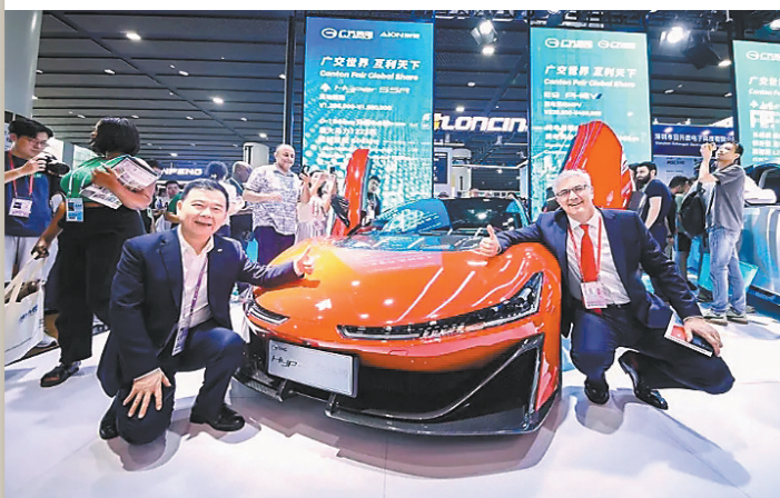
广交会上广汽集团展位成了热门打卡地

此外,广汽本田也积极响应国家“以旧换新”政策,旗下型格、雅阁、皓影、冠道等明星车型均带来了“置换补贴11000元(至高)+购车补贴40000元(至高)”等政策,最高综合优惠达到了5.1万元。