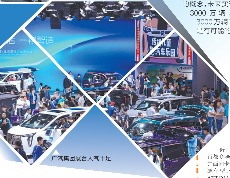
广汽集团展台人气十足

造车新势力在4月的销量数据尤为引人瞩目,其中不乏新入局的佼佼者,一登场便大放异彩;也有早已崭露头角的品牌,持续领跑新势力月度销量榜;然而,也有部分品牌开始面临增长的压力。