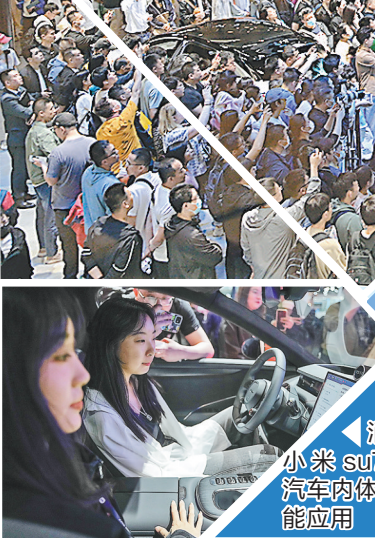
消费者在小米su7新能源车车内体验人工智能应用

近日,国内厂商和造车新势力陆续公布了4月的销量。由于月底北京车展的催热,各企业新品牌、新车型发布逐渐启动,市场开始蓄力进入新产品密集发布期,消费者关注度提高,乘联会预计4月底到5月的车市销量将会有望回温。从全球各国销量来看,目前表现相对较好的是欧美发达国家市场。中国车市走势总体较好。专家预计,在海外打造新的中国车市的概念,未来实现国内3000万辆、海外3000万辆的销量是有可能的。