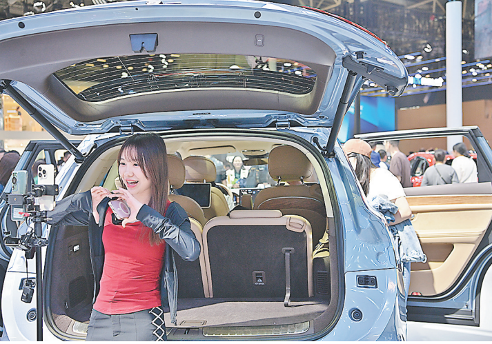
一名主播在2024北京车展上介绍一款使用华为鸿蒙系统的汽车

圆满落幕之际,全球目光再次聚焦中国汽车行业。此次车展不仅汇聚了全球知名品牌的尖端科技与产品,更是中国自主品牌加速国际化步伐、展现产业崛起与自信的重要舞台。