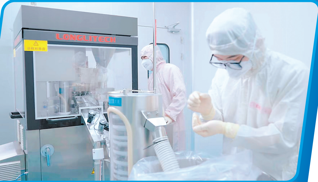
广州工行针对科创企业的特点推出配套专属产品及服务作为支持，全方位服务新质生产力

培育新质生产力成为时下经济社会的热词。科技创新能够催生新产业、新模式、新动能，是发展新质生产力的核心要素。作为链接科技和产业的重要工具，金融业正加速提升服务新质生产力能力，塑造发展的新动能新优势，助力现代化产业体系建设。工商银行广州分行（以下简称“广州工行”）把服务新质生产力作为主责主业，积极探索科技金融服务新模式、新路径，激发科创企业新活力，助力发展新质生产力。截至2024年一季度末，广州工行科技型企业有贷户超过4300户，全量融资余额超850亿元。