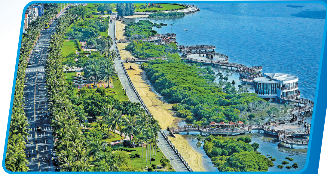
霞山观海长廊沿岸风景优美