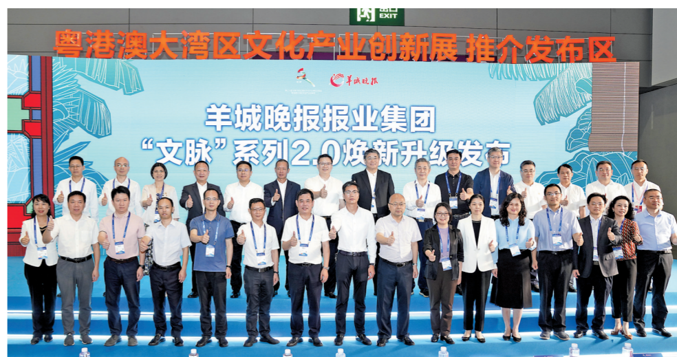
羊城晚报报业集团“文脉”系列2.0焕新升级计划于5月25日发布