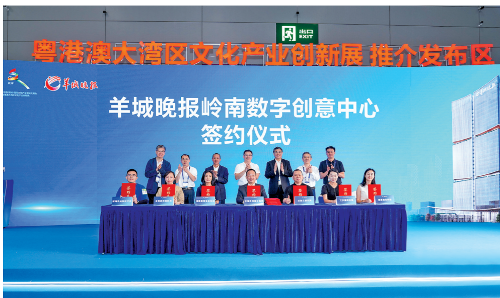
活动上举行的羊城晚报岭南数字创意中心战略签约仪式