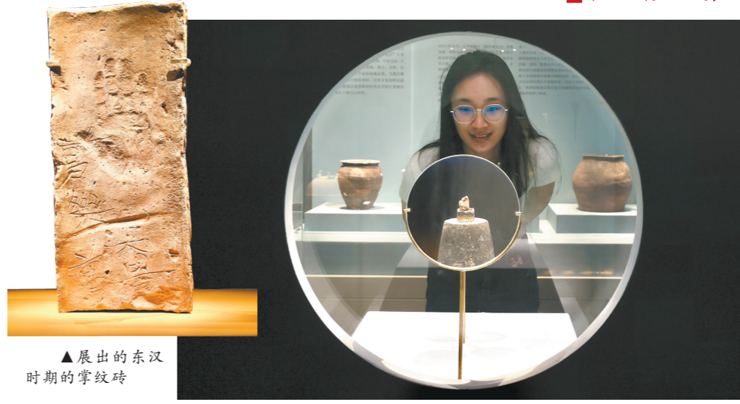
▲展出的东汉时期的掌纹砖