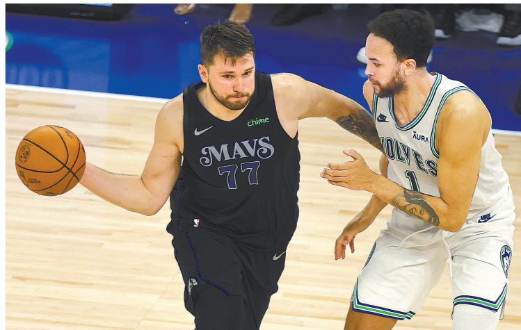
李凯尔(右)或是防守东契奇(左)的更佳人选

尔，但客观存在的篮板球劣势还是让他决心用戈贝尔赌一赌。 比赛首节双方便陷入缠斗，比分交替领先，森林狼不断冲击内线拿分，独行侠则内外开花给出回应，纳兹·里德手感火热连中三分，森林狼持续发力获得两位数优势，东契奇得分助攻一肩挑带队追赶，半场战罢森林狼以60比48领先12分。易边再战，森林狼命中率下降，东契奇则高效输出带队不断蚕食分差，末节欧文命中三分球反超，此后双方争夺陷入白热化，关键时刻森林狼当家球星爱德华兹连续带球拿到6分但出现关键失误，东契奇随后单挑戈贝尔并完成三分球准绝杀，只给森林狼留下三秒钟，最后时刻爱德华兹将球“甩锅”给队友纳兹·里德，后者三分线外仓促出手不中，最终独行侠在客场以109比108再胜森林狼，系列赛大比分2比0领先。 全场比赛，东契奇得到32分10个篮板13次助攻的三双数据，欧文得到20分4个篮板6次助攻；森林狼除了纳兹里德的23分，老将后卫康利的18分外，其他人再无亮眼发挥，当家球星爱德华兹尽管也得到21分，但他在关键时刻胆怯地选择“隐身”，还是在赛后饱受质疑。 在丢失了两个主场后，森林狼接下来将奔赴达拉斯进行系列赛的第三、四场，双方第三场较量将在北京时间5月27日8时进行。