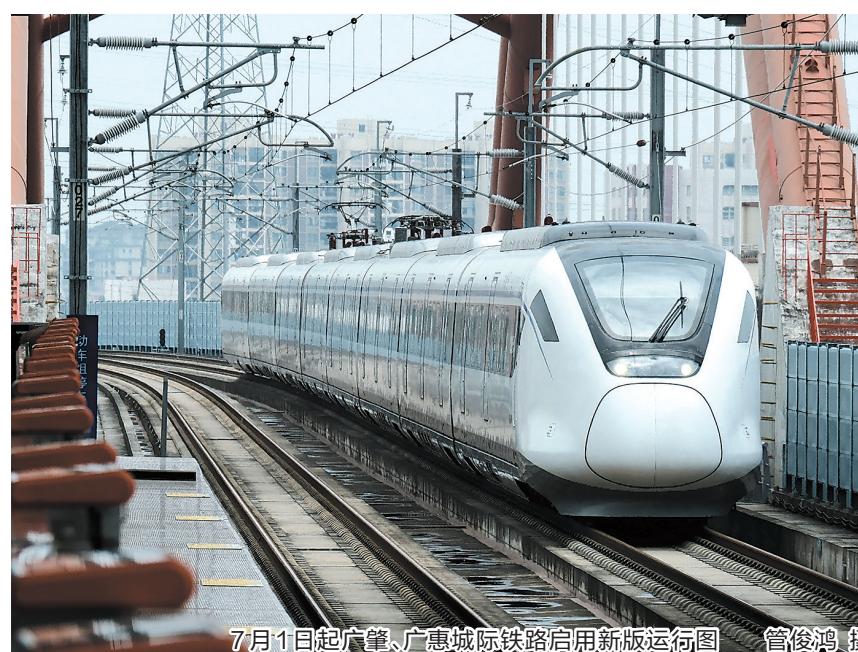
7月1日起广肇、广惠城际铁路启用新版运行图

羊城晚报讯 记者严艺文，通讯员贺敬、吴思慧报道：记者6月27日从广州地铁集团广东城际运营公司获悉，自7月1日起，广肇、广惠城际铁路将启用新版运行图。调整后，将分为工作日和周末两种运行图，大站快车停靠点也将新增广州莲花山站、云山站两个站。届时，“番禺站—小金口站”区段大站快车平均行车间隔将大大压缩。