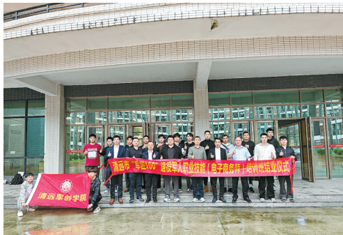
广东岭南职业技术学院为清远退役军人提供岗前培训、技能培训、就业创业等服务，帮助他们加快角色转变

为提升退役士兵大学生的荣誉感、归属感，退役军人服务中心制定了一系列优待政策。一直以来，该校退役军人服务中心对退役士兵大学生实行“一对一”联系机制，简化了退役复学、转专业学习等事务。同时，该校推出《广东岭南职业技术学院大学生应征入伍工作管理办法》，做到学费减免、奖学金评选、学分置换、推优入党、优秀毕业生评选、就业推荐等政策向退役士兵大学生倾斜。例如，退役学生可通过优待政策每年减免学费1.6万元，获助学金3300元。