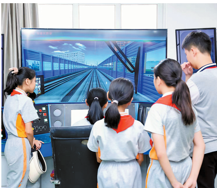
活动现场组织了职业体验实践课

近期，广州市教育局依托高职、中职学校立项建设了一批中小学职业体验中心暨中小学劳动教育实践基地项目，活动现场举行了授牌仪式。基地的设立将进一步丰富学校的劳动教育资源，为学生树立正确的职业观、劳动观和人生观，提高学习能力、实践能力和创新能力提供更多机会。