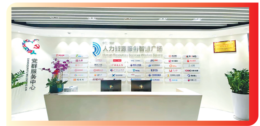
在西部产业园前台,众多入驻机构“上岗”

搜集企业人力资源需求,联合各街道举办经理人座谈会、劳务供需对接会,畅通用工企业与人力资源服务企业交流对接渠道,助力企业推广产品、拓展业务,聚力解决企业的融资难题与优化扩产需求,吸引更多优质企业“闻风而来”,为龙岗高质量发展拾柴添薪。