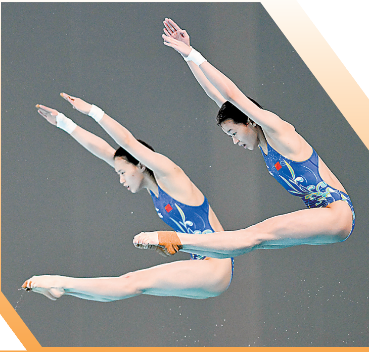
全红婵陈芋汐(左)在比赛中

经过三年,中国跳水“梦之队”顺利完成了新老交替,也经受住了各项大赛的洗礼。展望巴黎奥运,其实没有对手能撼动中国跳水队的统治地位,10位世界冠军组成的超强阵容,唯一的悬念在于能否包揽八金。