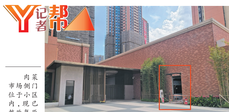
肉菜市场侧门位于小区内,现已整改复原

新建小区隔壁配套建设一个肉菜市场,本是一件便民好事,不过广州一小区的业主却为此起了争议。近日,广州市天河区珠江花城的业主发现,紧邻小区出入口、正在装修施工中的公共肉菜市场,侧面墙体却留了一个可以直接通往小区内部的门洞。有业主认为,公共场所不能侵蚀到私人空间,担心此举会让外来人员可经肉菜市场侧门随意进出小区,存在安全隐患。