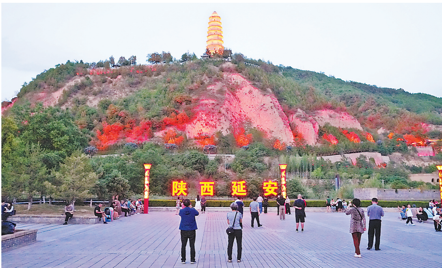
延安宝塔山

家是最小国,国是千万家。在新中国成立75周年之际,羊城晚报记者来到延安,通过实地走访,感受先辈们革命为先的家国情怀。