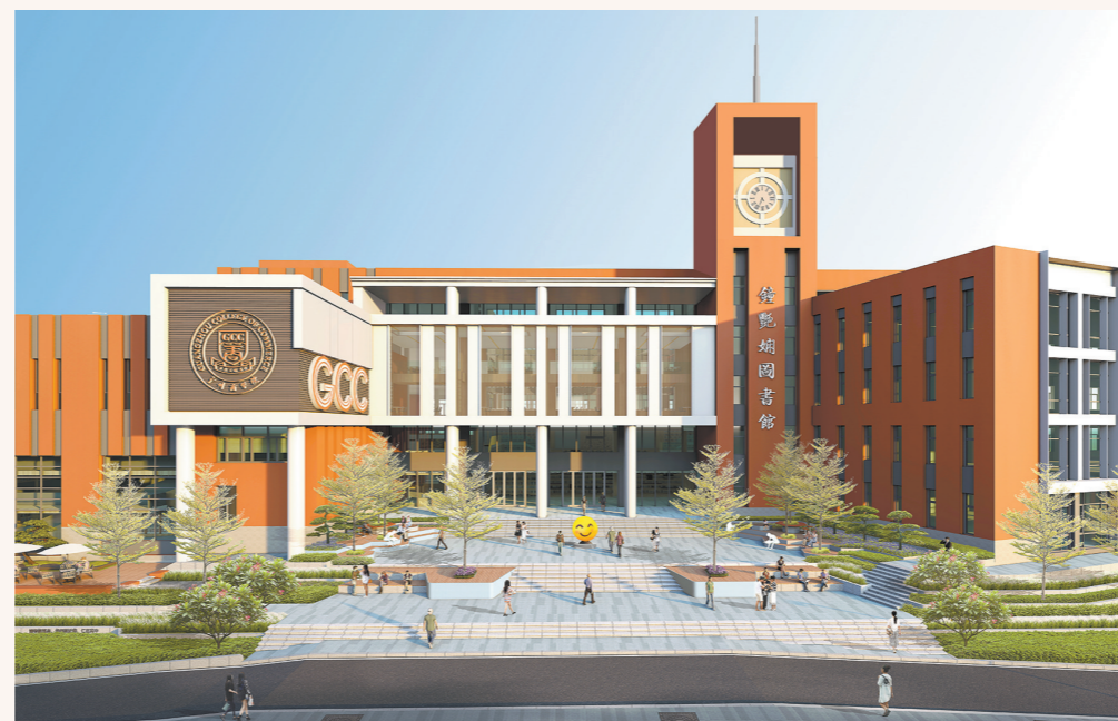
▲广州商学院图书馆▼

7月19日,广东省2024年普通高考本科批次正式投档录取。从投档情况看,广州商学院全专业一次性满档,其中,国际学院生源质量取得历史性突破!中英双语创新班历史类203专业组超省控线18分,较去年排位提升9595位;国际联合培养专业物理类206专业组超省控线5分,较去年排位提升8940位。