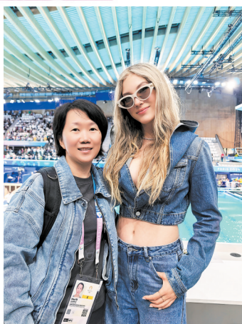
羊城晚报记者与谷爱凌合影