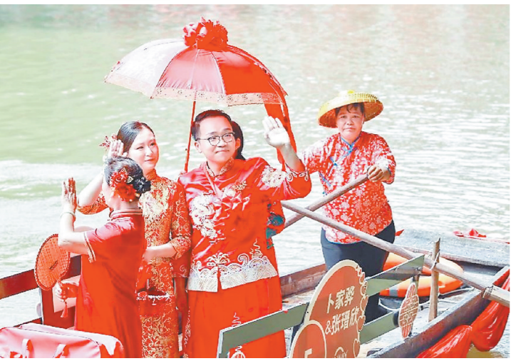
新人向观众们打招呼

羊城晚报 记者冷霜摄影报道：8月10日上午，南沙区东涌镇水乡风情街人声鼎沸，新人们穿着传统婚服乘船缓缓驶入亲水平台，2024年南沙区东涌镇第六届水乡集体婚礼在七夕佳节拉开帷幕。2对金婚、银婚夫妻与来自大湾区各行各业的10对新人们共同见证爱情的力量和文化的传承。