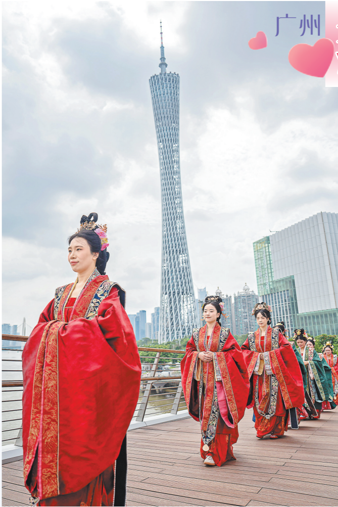
新娘身着传统婚服款款而来

羊城晚报 记者符畅、实习生黄紫晴、通讯员曹怡淳报道：8月10日，由广州市天河区文化广电旅游体育局、广州塔旅游文化发展股份有限公司联合主办的2024“缘满珠江”汉式集体婚礼在海心桥盛大举行，14对新人参与。