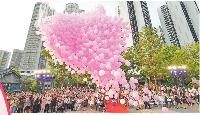
婚庆“气球”让融德里浪漫氛围满满 通讯员供图