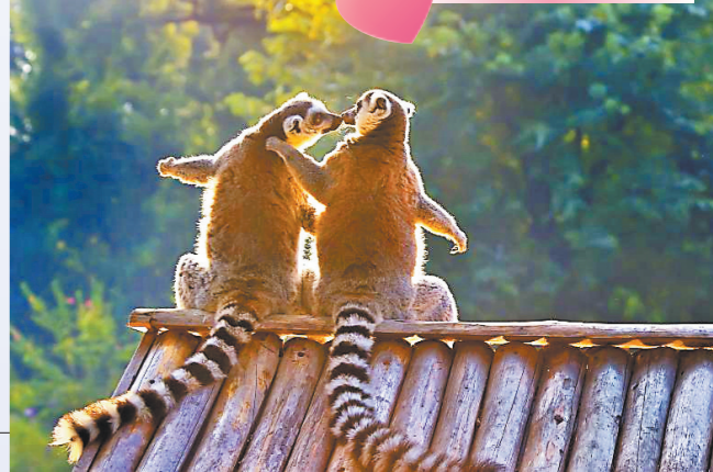
环尾狐猴在晨光中甜蜜依偎

羊城晚报 记者孙牧、通讯员王益摄影报道：西瓜、南非蜜橘、榴莲、葡萄……8月10日上午，一辆辆满载“甜蜜”的水果专车，相继抵达广州动物园内马来熊、河马、小熊猫等动物展区，为动物萌宝们送上长达1520斤的十余种七夕水果“豪礼”。