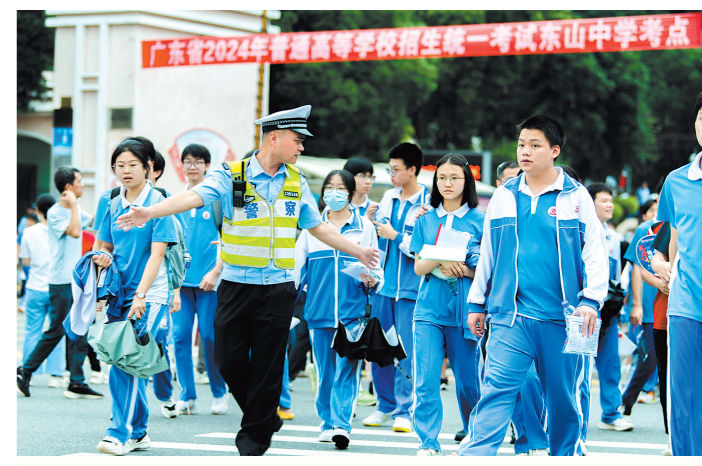
2024年高考期间，梅州市东山中学考点外，民警引导考生有序离场

近年来，广东公安从严管党治警出台新举措，公安队伍向心力凝聚力战斗力明显提升。坚持党建引领强根基，认真落实省委“基层党组织建设强基工程”部署，深入推进红旗党支部和“四强”党支部创建，引领发挥基层党组织战斗堡垒作用和党员先锋模范作用。全面从严管党治警守底线，出台系列“小切口”严管厚爱措施，强化“零容忍”监督执纪。