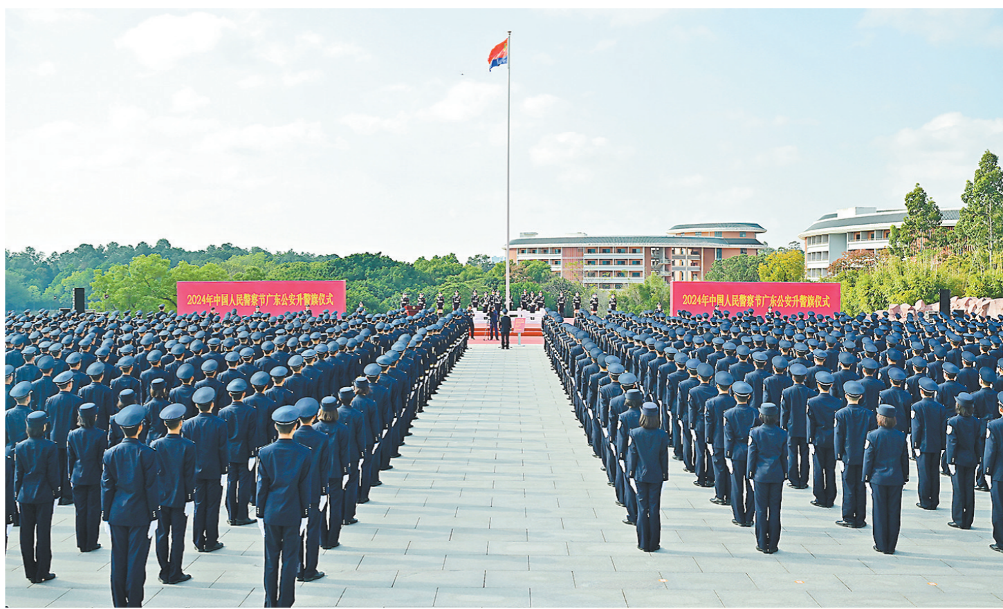
广东省公安厅举行2024年中国人民警察节升警旗仪式

在广州琶洲广交会展馆，场馆内外的“警察蓝”身影，守护着一场场展会安全有序举行。警务室里，满墙锦旗，声声多谢。