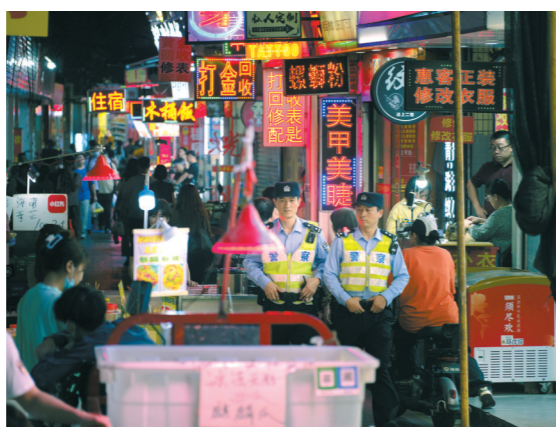
广州市公安局天河区分局民警在辖区巡逻