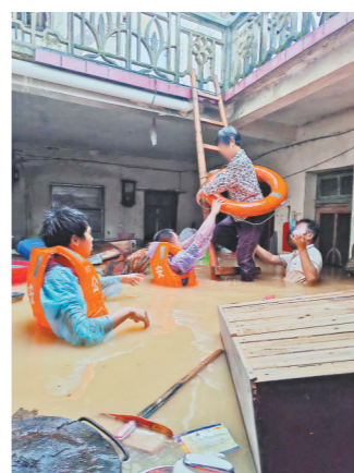
梅州平远县大柘镇坝头村，民警转移被困洪水的群众