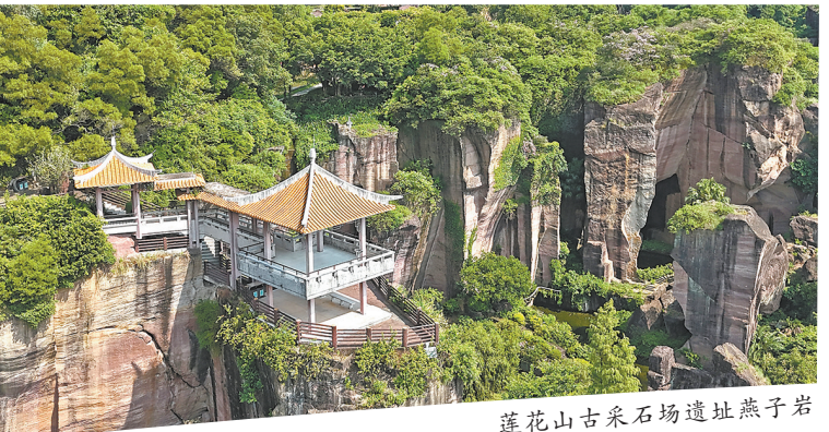
莲花山古采石场遗址燕子岩

苏轼咏岭南的“日啜荔枝三百颗,不辞长作岭南人”世人皆知,其实前面还有两句“罗浮山下四时春,橘柚杨梅次第新”,是告诉大家,东坡先生正是面对“岭南第一山”——罗浮山发出的这番感慨。