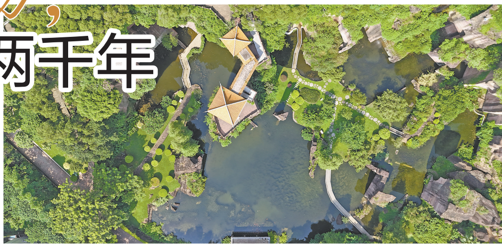
俯瞰莲花山古采石场遗址燕子岩