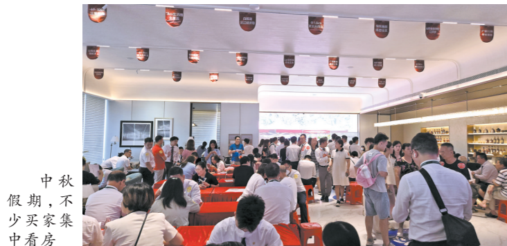
中秋假期，不少买家集中看房

对于购房者存在的降价焦虑，目前，部分开发商再度采用“保价”营销的手段。以新入市的保利雅都为例，如果购房者选择保价房源，开发商承诺价格为年内最低价，买贵可享有无忧换。不过，“保价”营销也并非在中秋假期才在市场出现，今年早些时间，天河区、花都区陆续有项目开展持续时间不一的“保价”服务。但在购房者越发注重看得见的质量的当下，开发商需要以更多举措明确交付质量，让购房者对未来的生活放心。