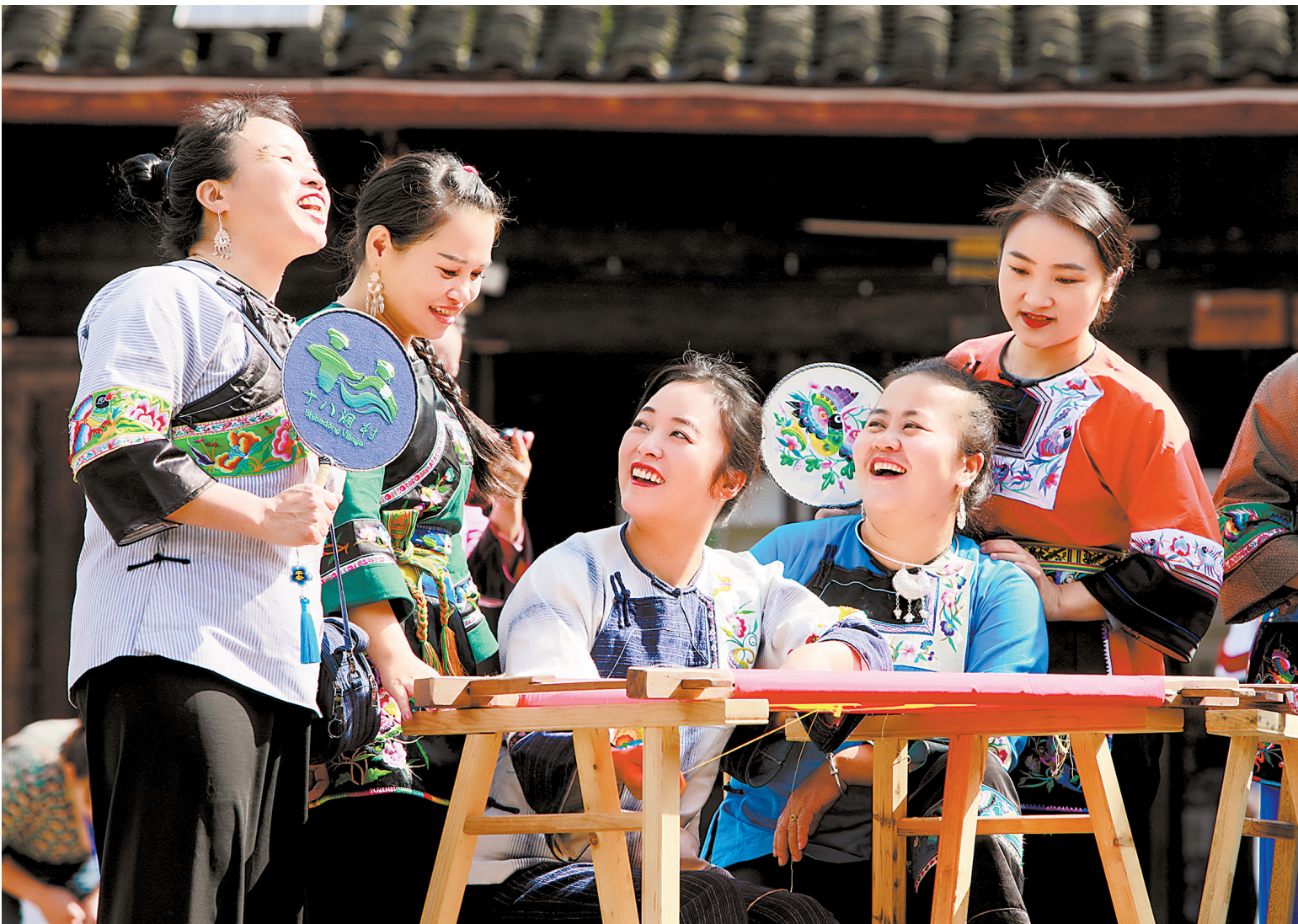
中国妇女第十三次全国代表大会召开前夕,十八洞村的绣娘们一起绣制作品 受访者供图(资料图)

在新中国成立75周年之际,羊城晚报记者深入基层,探访湖南花垣十八洞村和广东英德连樟村,倾听乡亲们和村干部讲述融入国家发展浪潮、创造美好生活的奋斗故事,在一幅幅生活实景画中感受脱贫攻坚精神里的家国情怀。