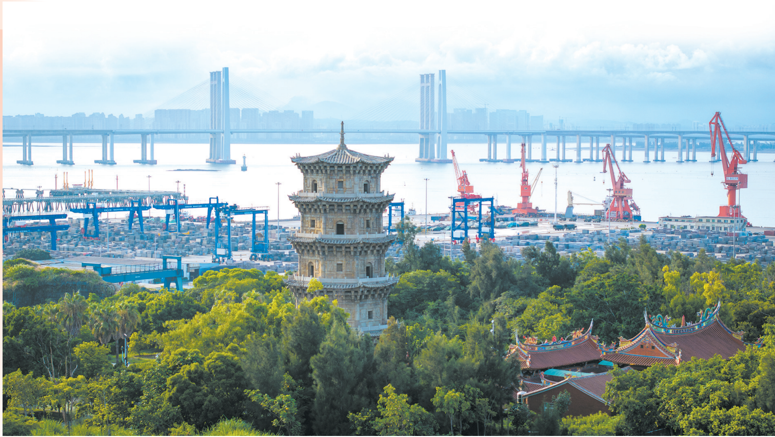
泉州六胜塔是古代海上丝绸之路的重要航标塔,如今依然矗立在泉州湾入海处。塔底下是繁忙的码头,远处是泉州湾大桥

丝路精神传承千年,家国情怀植根血脉。新中国成立75周年之际,羊城晚报记者重走海上丝绸之路,从历史印记中体悟精神伟力。