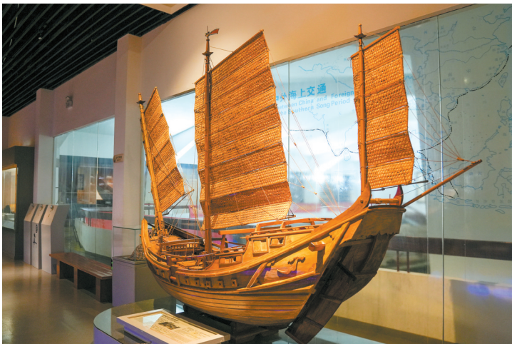
泉州湾宋代古船复原模型

今年是这艘宋代海船出土50周年,泉州海交馆组织了一场特别的研学夏令营,带小朋友们来古船发掘地后渚港,对话见证者、修复者、守护者,了解“会说话的古船”。