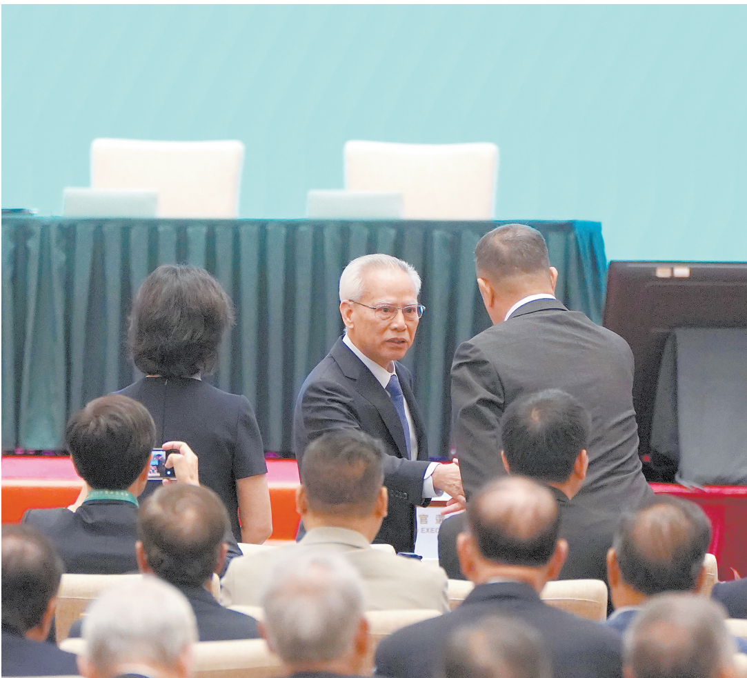
当选后，岑浩辉到场与选委会委员见面

岑浩辉表示，他将团结带领社会各界及广大市民，更好地发挥政府的引导作用，充分调动各方面的主动性、积极性及创造性，听民意、汇民智、聚民力，推动社会经济、文化、民生事业全面发展。他将为民、为澳、为国恪尽职守，竭诚奉献，以法治为核心继续守护社会公平正义，守护民心，不断提升治理能力及管治水平，让市民在不断优化的公共服务体验中拥有更多的幸福感，以求真务实的工作作风用心为民办实事，不负广大市民期望。